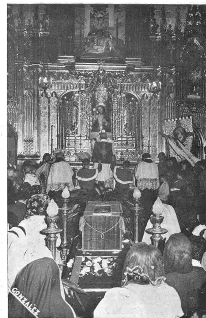
Momento de la Elevación de la Sagrada Forma en la misa que siguió al Desfile. En alto se ve el hermoso grupo escultural de Nuestra Señora al Pie de la Cruz.