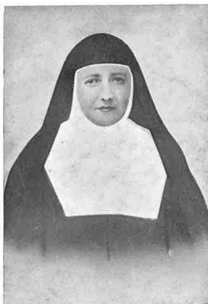
La Sierva de Dios, a los 50 años.