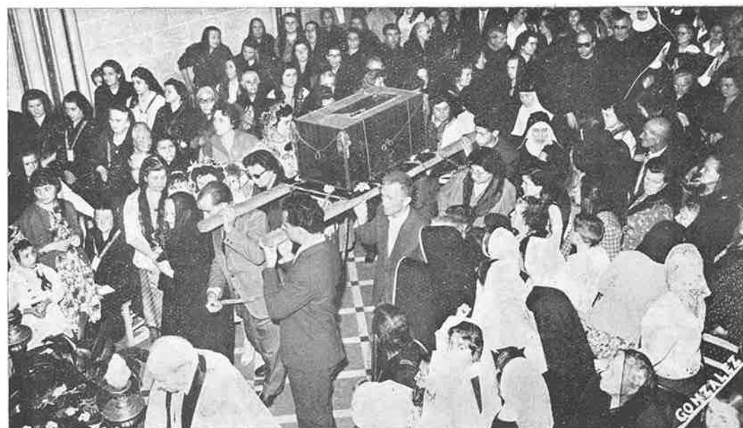
Vuelta a la Iglesia del Monasterio.