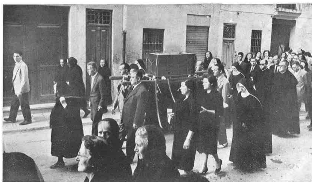
Durante el desfile, la Urna con los restos de la Sierva de Dios es llevada a hombros por los varones parientes de la misma, mientras las mujeres (también parientes) con unas Religiosas Siervas de María «Mantellate» llevan cintas encarnadas.