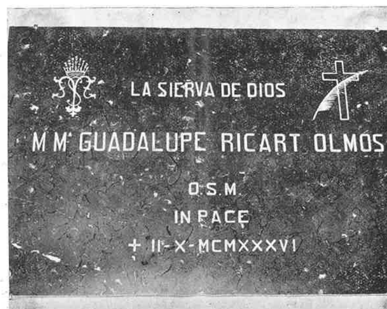
Lápida que cubre los restos de la Madre M. a Guadalupe.