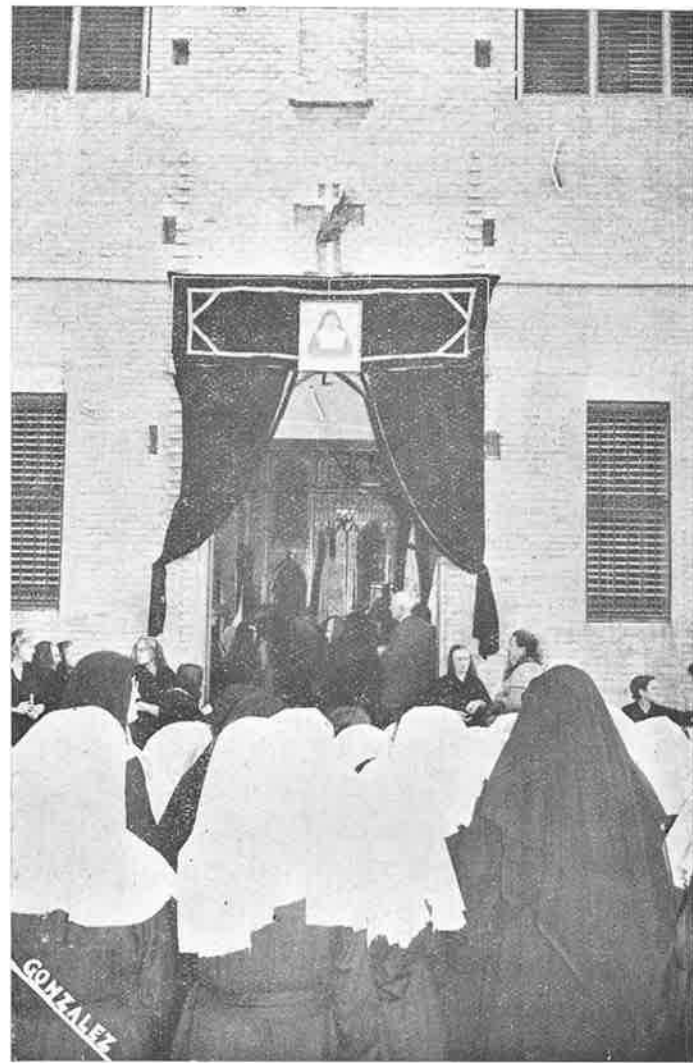
Vista de la fachada de la Iglesia del Monasterio, durante la Ceremonia en su interior.